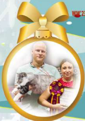
NW SC BOSS SKOGKATT NORSK *ES JW