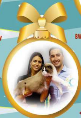
SC NO* ELINS DIAMANTER IRRESISTIBLE ISAAK AV BARON JW