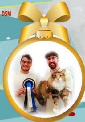
BW24'21' NSW23' NW23' SC_ORXATA DE VELLAN*ES JW, VVM