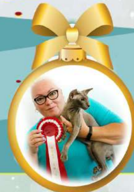
NW SC ANUK ANIKACHI*ES JW