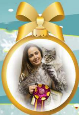
SC ES* ALHAMBRA MOON VENUS