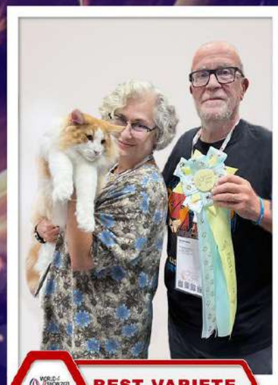
Orlando de Tsavo JW