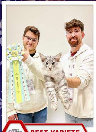
IT*Mellon Bliss Lotus